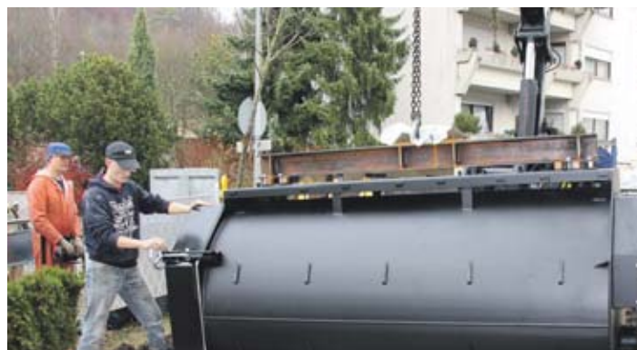
Der Biomassekessel für die Pellets wird in einem Gebäude installiert und versorgt von dort aus auch alle anderen Objekte sternförmig mit Wärme.