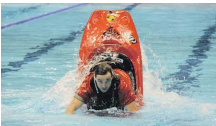
Die Kanuten des Faltbootclubs Heidenheim bewiesen bei der Eröffnung ihr Können.