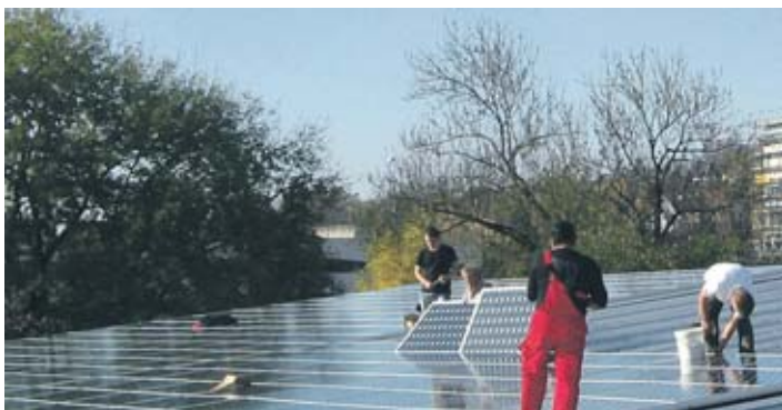
Oktober 2009: Die Erstellung der Photovoltaikanlage macht von Tag zu Tag Fortschritte.