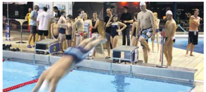
Beim Wünscheschwimmen am Nikolaustag wurden Kinderwünsche erfüllt. 1.400 Bahnen für ca. 50 Geschenke. Alle legten sich mächtig ins Zeug, um keinen Wunsch offen zu lassen.

Das Ergebnis nach knapp 2 Wochen Marathon: Tausende Schwimmer haben die Aktion unterstützt und 33.492 Bahnen gezogen. Das entspricht rund 1675 Kilometern und einer Strecke von Heidenheim bis Sizilien. In Summe wurden so 5.023,80 Euro für den guten Zweck erzielt.