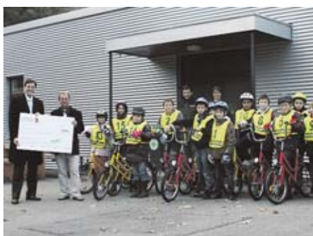
Scheckübergabe vor dem renovierten Gebäude der Jugendverkehrswacht nach dem absolvierten Training einer Schulklasse.